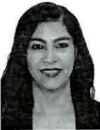
Integrante (MORENA) Dip. Martina Cazares Yañez