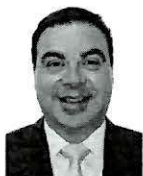
Integrante (MC) Dip. Jorge Alcibiades García Lara